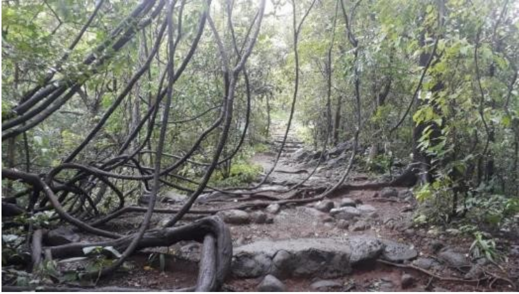
घनदाट अरण्य (मार्ग स्वर्गाचा)