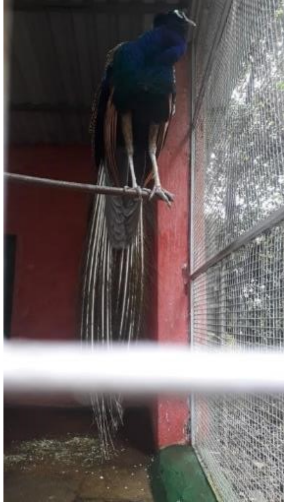
संग्रहालयात ठेवण्यात आलेला मोर