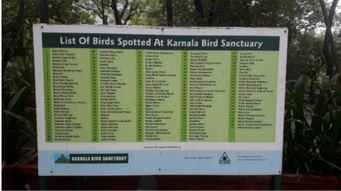
१४१ पक्ष्यांची नावे असलेले फलक