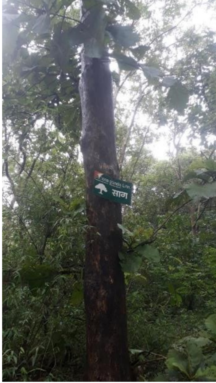
वाटेत असलेले सागाचे झाड