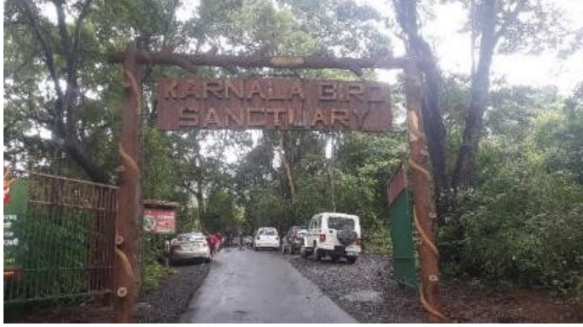
कर्नाळा पक्षी अभयारण्याचे मुख्य प्रवेशद्वार