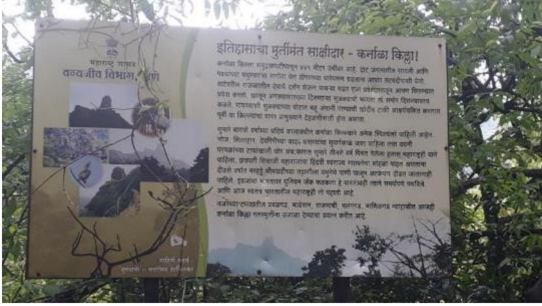
किल्ले कर्नाळ्यावर आधारित माहिती फलक