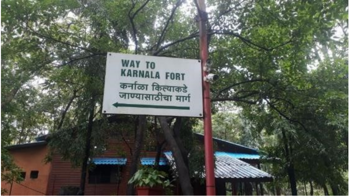
गडावर जाण्यासाठी लावण्यात आलेले दिशा दर्शक