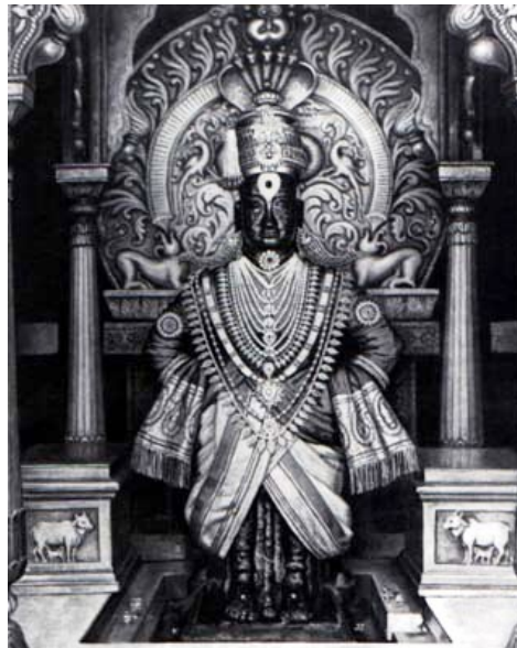
Lord Vitthala of Pandharpur, Maharashtra, India