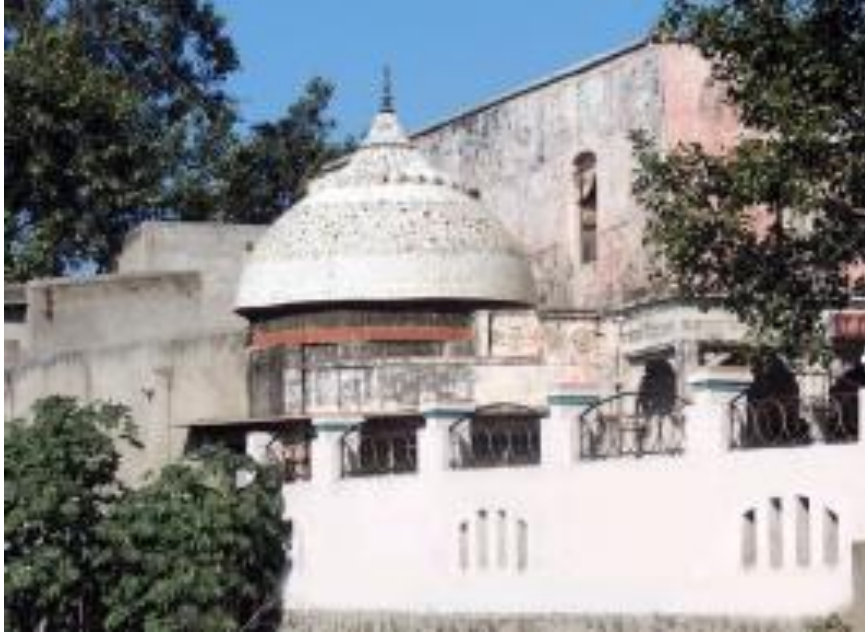
वीर हनुमान मंदिर, खामगांव

सरकार विरोधात कार्य करतांनाच शिक्षण क्षेत्रांतही कार्य करणे सोपे नव्हते. पण देणाऱ्याचे हात बळकट असले तर कार्य यशस्वी होते यांत शंका नाही. 'निश्चयाचे बळ, तुका म्हणे तेची फळ' याचे उदाहरण म्हणजे ही धर्मशाळा होय. याच काळात खामगावांत झुनझुनवाला कुटुंबाने धार्मिक प्रवृत्तीच्या लोकांना पूजापाठ करता यावेत म्हणून बोर्डी नदीच्या काठावर, ज्याला आज फरशीवरील हनुमान मंदिर म्हणून ओळखतात त्याची निर्मिती केली. 'वीर हनुमान मंदिर' म्हणजे धार्मिक प्रवृत्तीचे असूनही आधुनिक विचारसरणी स्वीकारणाऱ्या ह्या परिवाराचे उत्तम चित्र होय.