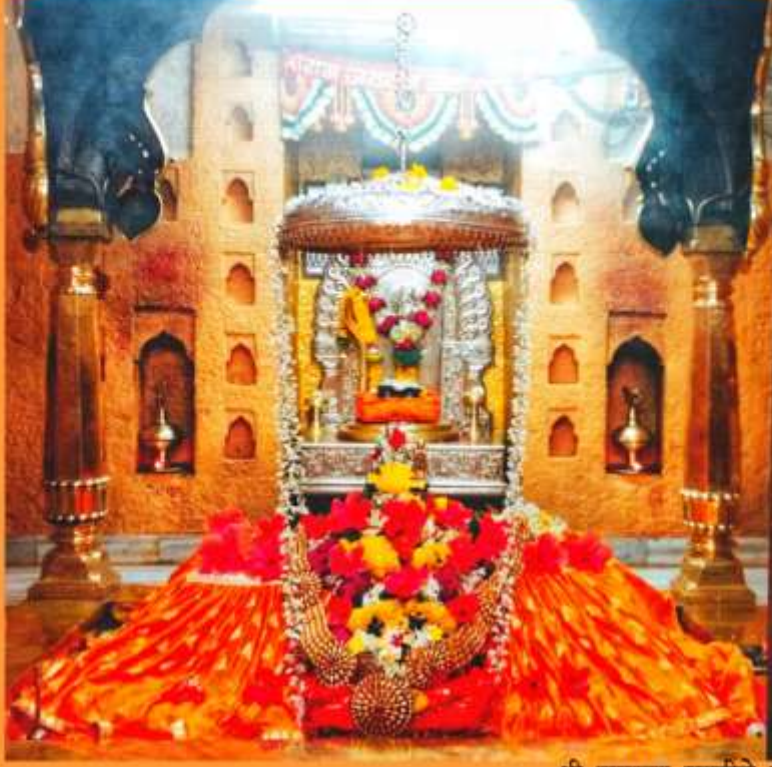
श्री रामदास स्वामींचे समाधीस्थान