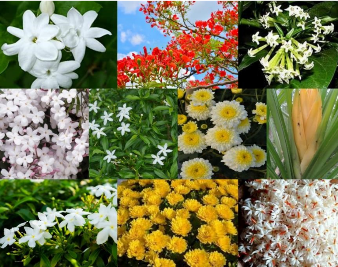
भारतीय फुलं (२)