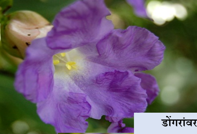
डोंगरांवर फुलणारी कारवीची फुलझाडं