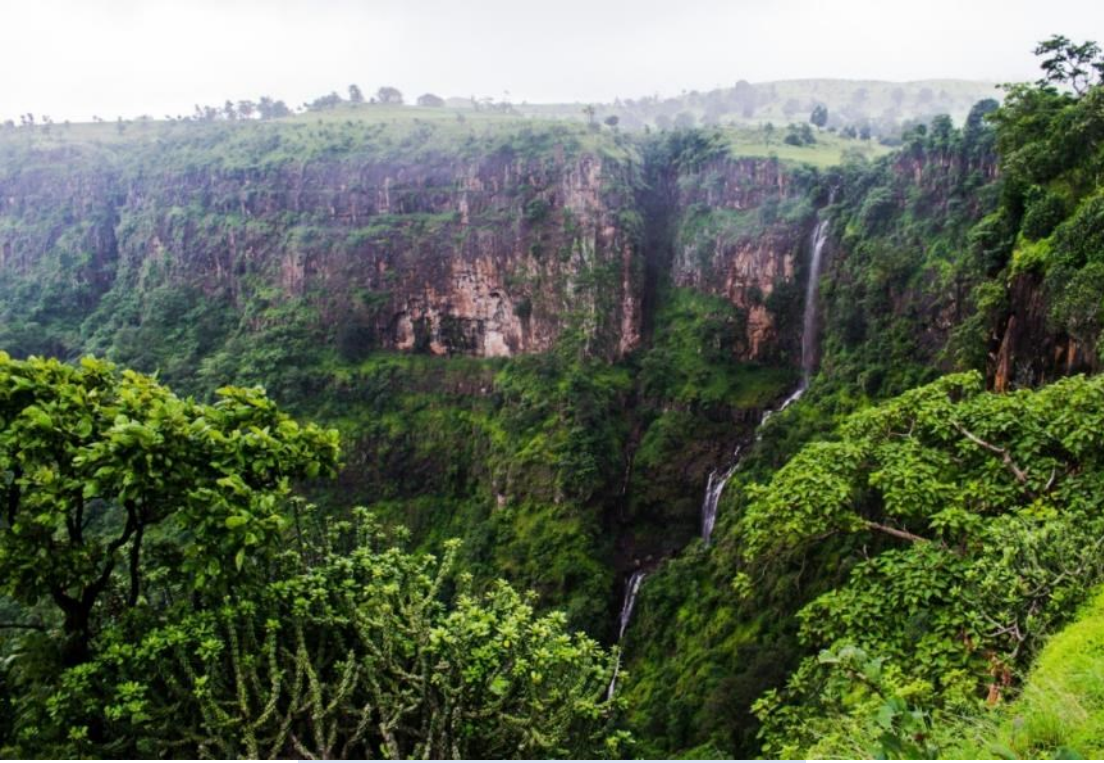
तोरणा वेली, तोरणमाळच्या