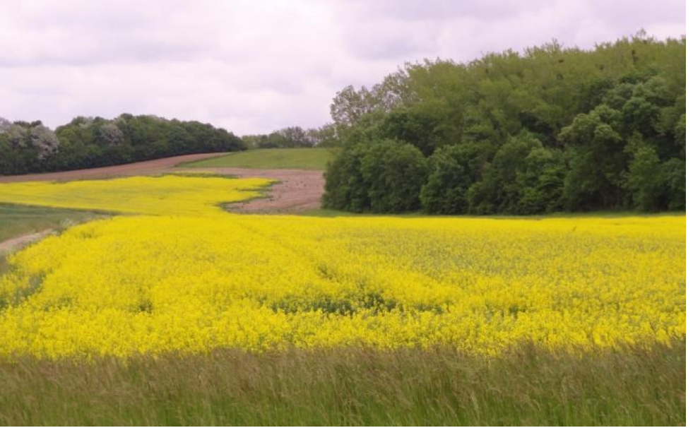
मोहरीच्या पिवळ्या जर्द फुलांनी डंवरलेली पिवळी शेतं

ते निसर्गप्रेम आणि आवड, परदेशी रहायला गेल्यावर तर खूपच वाढली. इंग्लंडसारखा देश म्हणजे खऱ्या अर्थी निसर्गसौंदर्याची लयलूटच. शहरापासून मैल दोन मैल दूर गेलं, की निसर्गसान्निध्य सुरूच. त्यातूनही, प्रत्येक ऋतूमानाचं सौंदर्य वेगळंच. कधी हिरवीगार शेतं, कधी मोहरीच्या पिवळ्या जर्द फुलांनी डंवरलेली पिवळी शेतं, रंगीबेरंगी रानफुलांचे ताटवे आणि हिरव्या लाल वृक्षवेली. त्यामुळे बघणाऱ्याचं मन हरखून गेलं नाही तरच नवल. निसर्गाची विविधरंगी रूपं आणि अदभुत किमया अनुभवतांना मनात नेहमीच असंख्य विचारांची दाटी होई – अशा बेचैनीमधूनच शब्दबद्ध झालेले काही अलौकिक अनुभव आणि विचार.