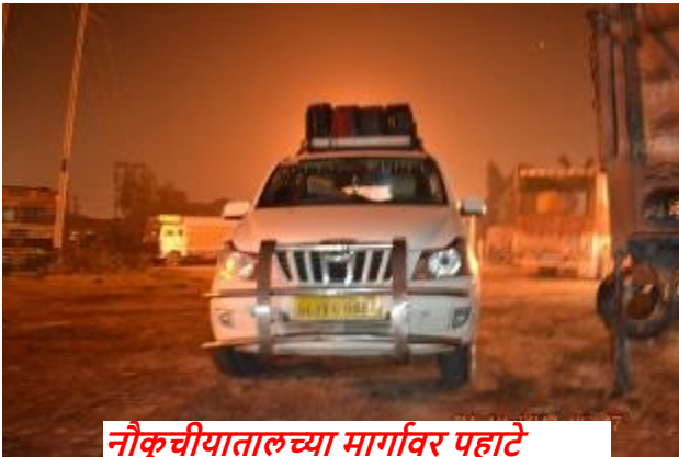
नौकुचीयातालच्या मार्गावर पहाटे

सकाळी हलद्वानी गावात एक बरे से हॉटेल पाहून चहा नाशत्याला थांबलो ( योगायोग असा की परतीच्या प्रवासात त्याच हॉटेलात आम्ही चहा नाशत्या करिता थांबलो होतो ). पुढे, पंत नगर, काठगोदाम करीत सकाळी नऊ – साडे नऊच्या सुमारास आम्ही नौकुचीयातालला पोहोचलो. दुसऱ्या