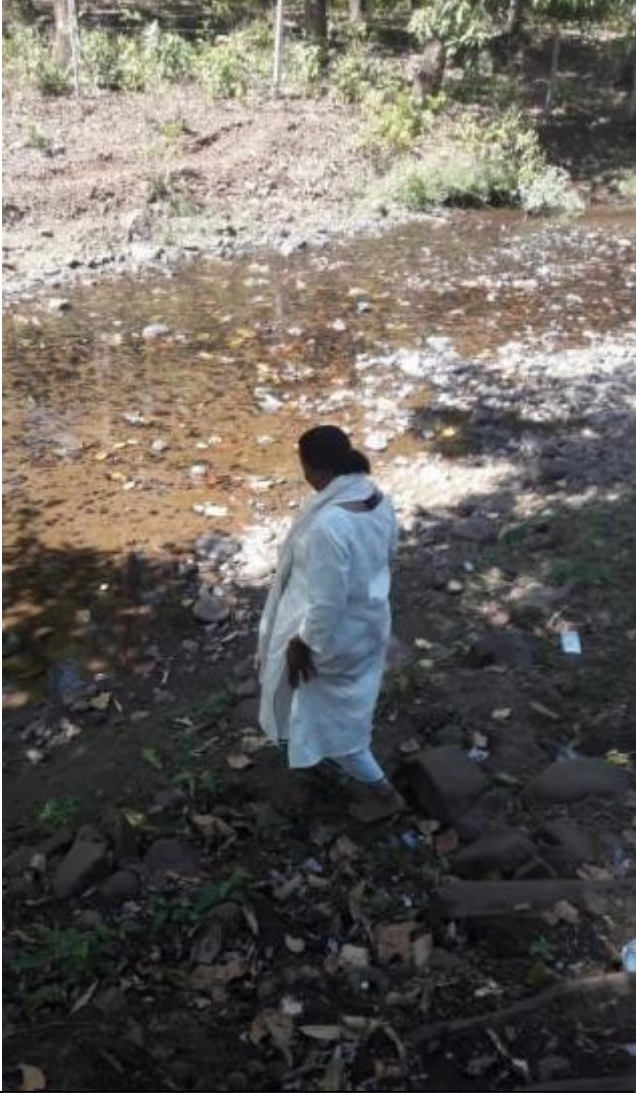
राम कुटीर ला लागून वाहणारी बाल नर्मदा

इतक्या शुद्ध मराठीत कोण बोलतंय म्हणून आम्ही त्याच्याकडे धावत गेलो. पाहतो तर पलीकडच्या भागावर एक संन्यासी उभे होते. अतिशय प्रेमळ चेहरा, आणि बोलके डोळे होते त्यांचे. नर्मदे हर झालं, एकमेकांची चौकशी झाली. मी नागपूरची म्हटल्यावर ते चक्क वन्हाडी भाषेत बोलायला लागले. "नागपूरची हाय कावं मावशी, म्या पांढुरन्याचा हावो". त्यांची ती भाषा ऐकून मला इतकं छान वाटलं म्हणून सांगु... चहा झाला गप्पा झाल्या आणि त्यांनी जे सांगितलं