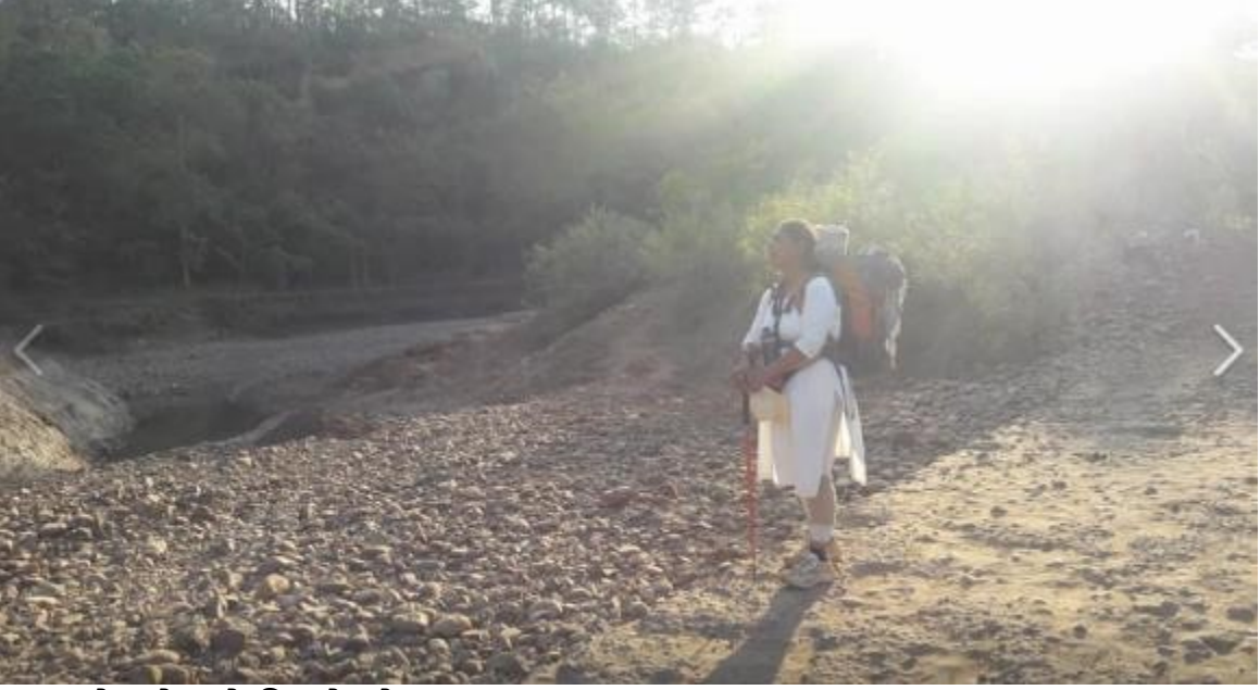
वाघोबाचे ठसे दिसले तो हाच रस्ता

झालेली पावलं, म्हणजे पावलांचे ठसे पुन्हा दिसू लागले.. म्हणजे वाघोबा आमच्या पुढे पुढे चालत होते आणि आम्ही मागे मागे... चला हे असं आहे हे बरं आहे, आम्ही पुढे आणि वाघोबा मागे असते तर काय झालं असतं तो विचार न केलेलाच बरा.