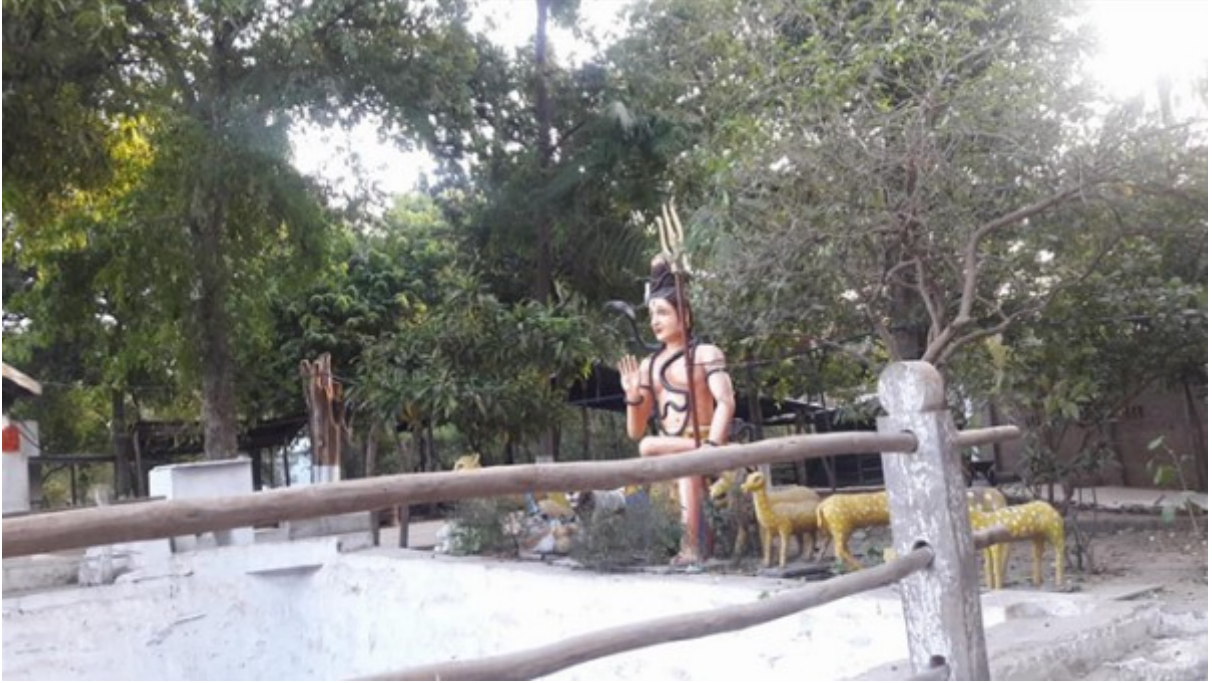
अतिशय रमणीय, च्यवन ऋषि आश्रम