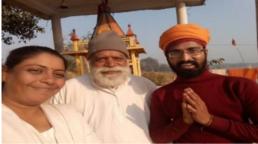
अनाधोराचे उन्मेषानंद महाराज, माझा नर्मदा भाऊ

शिवाय दूध आटवून आटवून घट्टशी तयार केलेली खीर, हे सगळे प्रकार होईस्तोवर संध्याकाळ झाली. आता मुक्कामाला आलेल्या परिक्रमावासी यांची भोजन प्रसादी करायची, तीसुद्धा माझ्या हातची झाली.