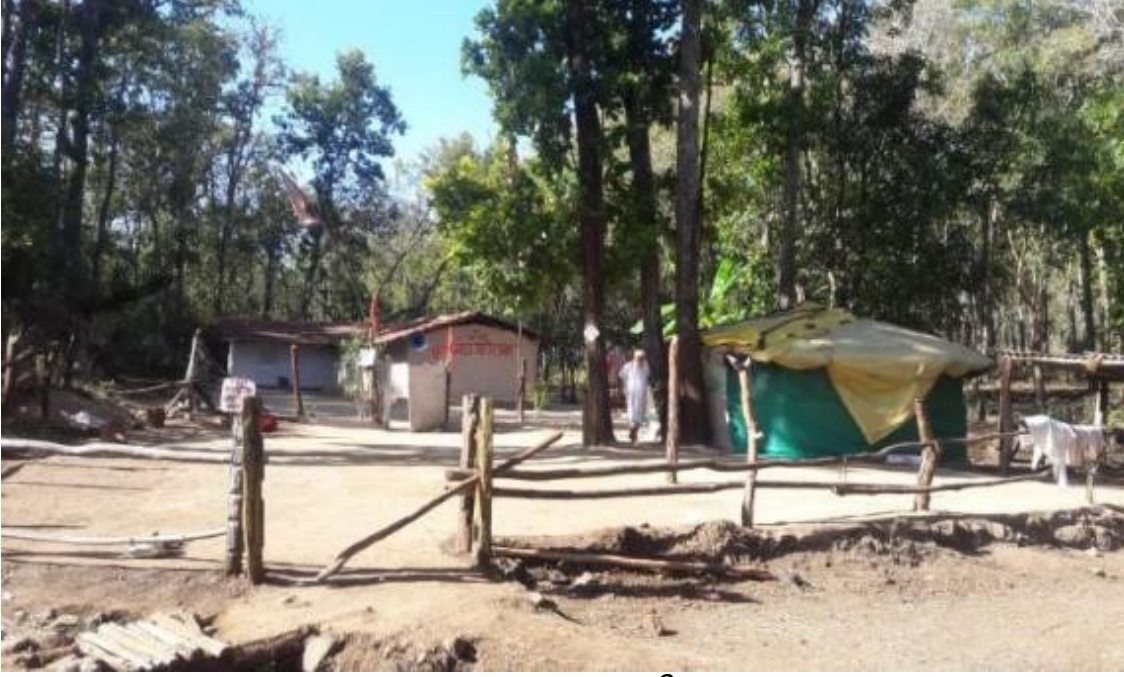
राम कुटीर आश्रम