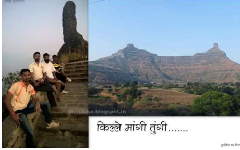
किल्ले मांगी तुंगी.....