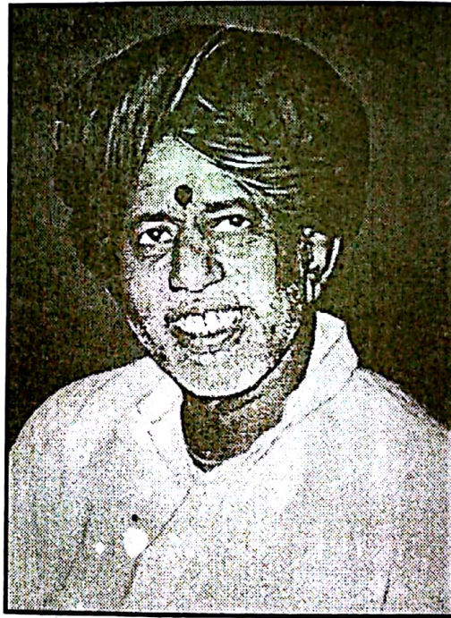
॥ श्री प.पु.स.स.चिंतामणी महाराज ॥