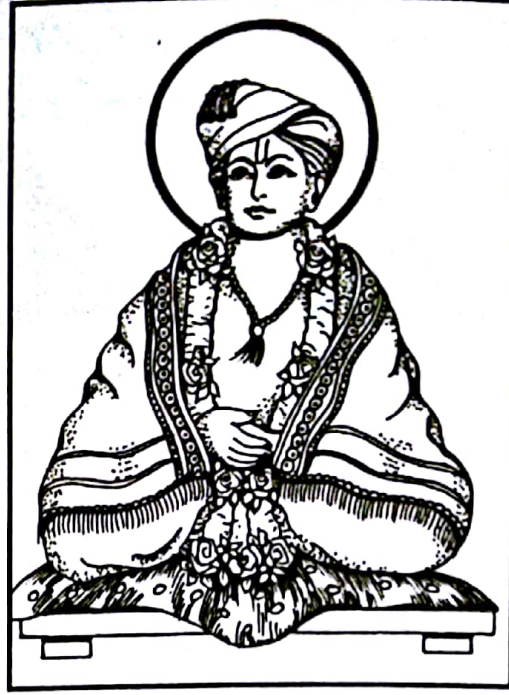
॥ श्री संत ज्ञानेश्वर माऊली महाराज ॥