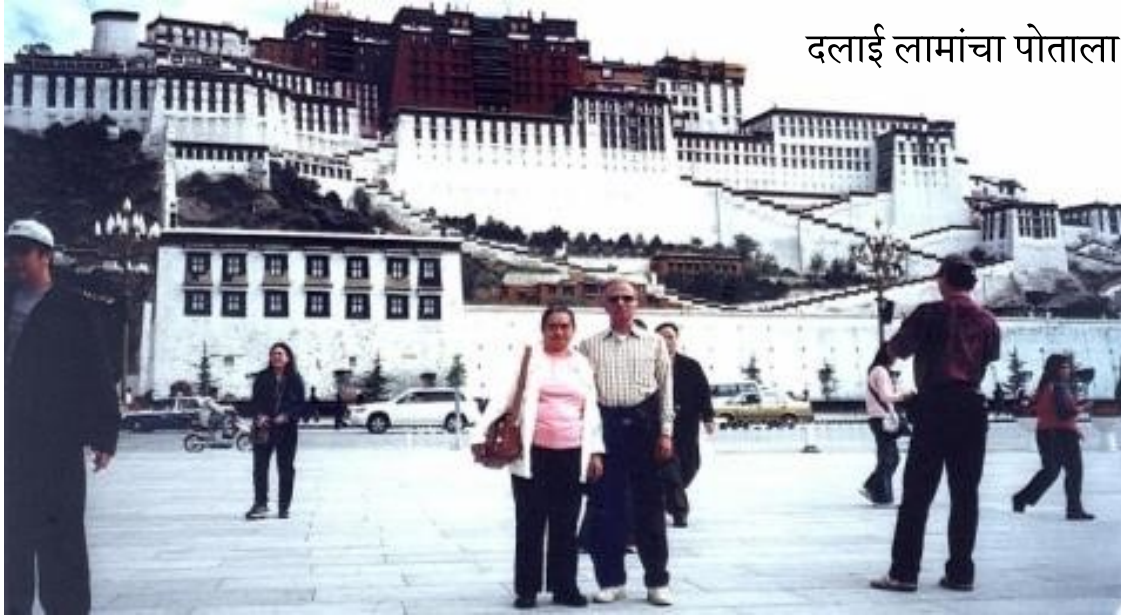
दलाई लामांचा पोताला पॅलेस