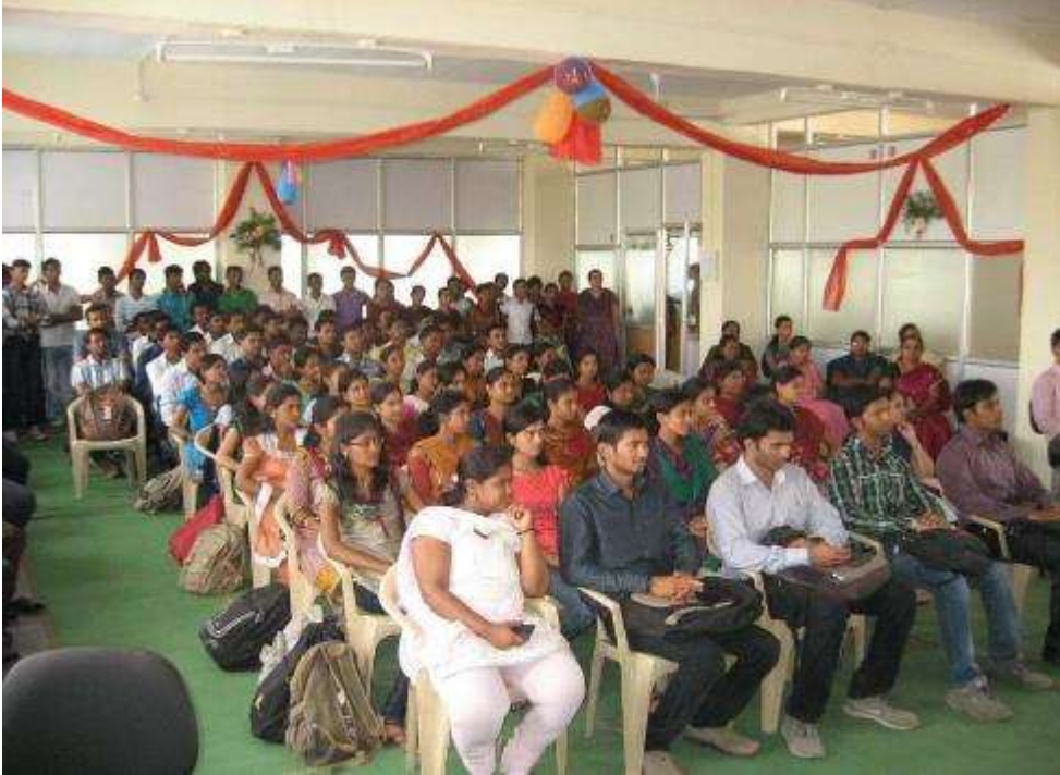
९. निरोप समारंभ

सुरुवातीला विभागप्रमुख, शिक्षक यांचे बोलून झाले. मग आमच्यातले कुणी आपले अनुभव सांगण्यासाठी, बोलण्यासाठी इच्छुक आहे का असे विचारण्यात आले. मग काय, सगळ्यांना किती सांगू आणि किती नको असे झाले होते. बऱ्याच मुलामुलींनी पुढे येऊन आपले आपले अनुभव सांगितले. कितीतरी जणांचे डोळे बोलता बोलताच पाणावत आणि ते त्यांचे बोलणे तिथेच थांबवत. आमचीही अवस्था काही वेगळी नव्हती. आम्हीही सगळ्या आठवणी ऐकून भावनिक झालो होतो. अशाच आठवणी ऐकता ऐकता कार्यक्रम संपला आणि परत फोटोशूट झालं. यात दिवस कसा गेला समजतंच नाही. दिवस संपला पण आठवणी मात्र मनात राहिल्या. 😊