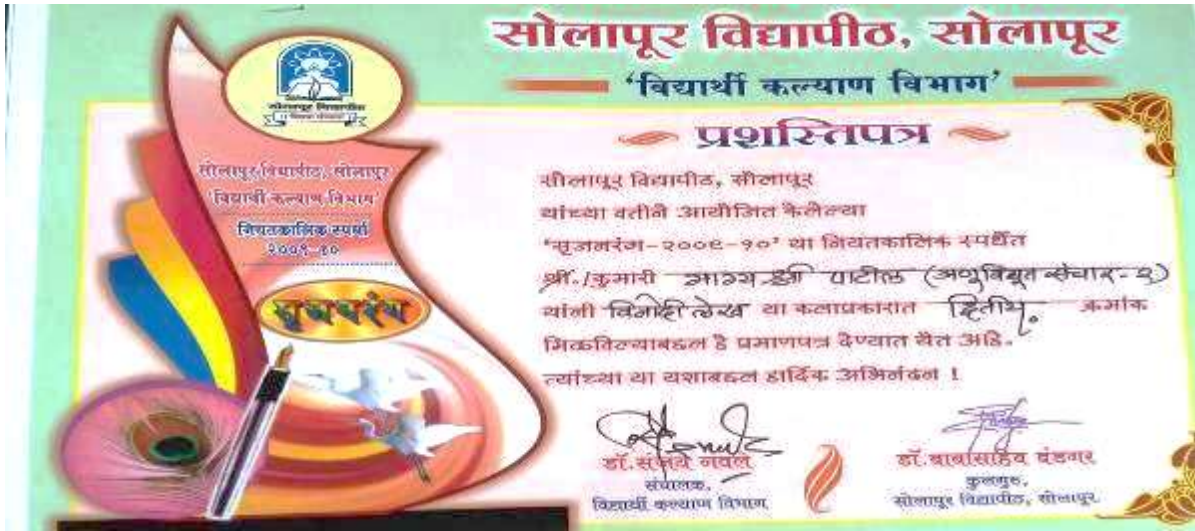
८.१ विनोदी लेखन प्रकारात मिळालेला दुसरा क्रमांक