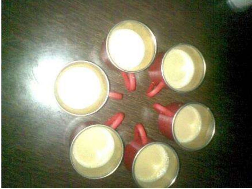
२. कॅन्टीन ची कॉफी

असतात. कॅन्टीन मध्ये साजरे केलेले वाढदिवस, फ्रेंड्स च्या पार्टी, रोजच्या गप्पा, गोंधळ, कायम लक्षात राहतो. कधी कधी मेस चे जेवण आवडले नाही की कॅन्टीनच तारणहार असायचे. कधी एकदा लेक्चर्स संपतात आणि कॅन्टीन ला जातो असं व्हायचं आम्हाला. 😊