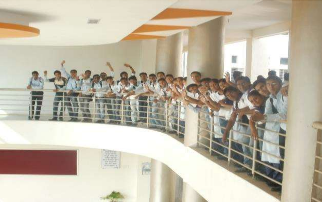
१०.१ कॉलेजच्या शेवटच्या दिवशी काढलेले काही फोटोज