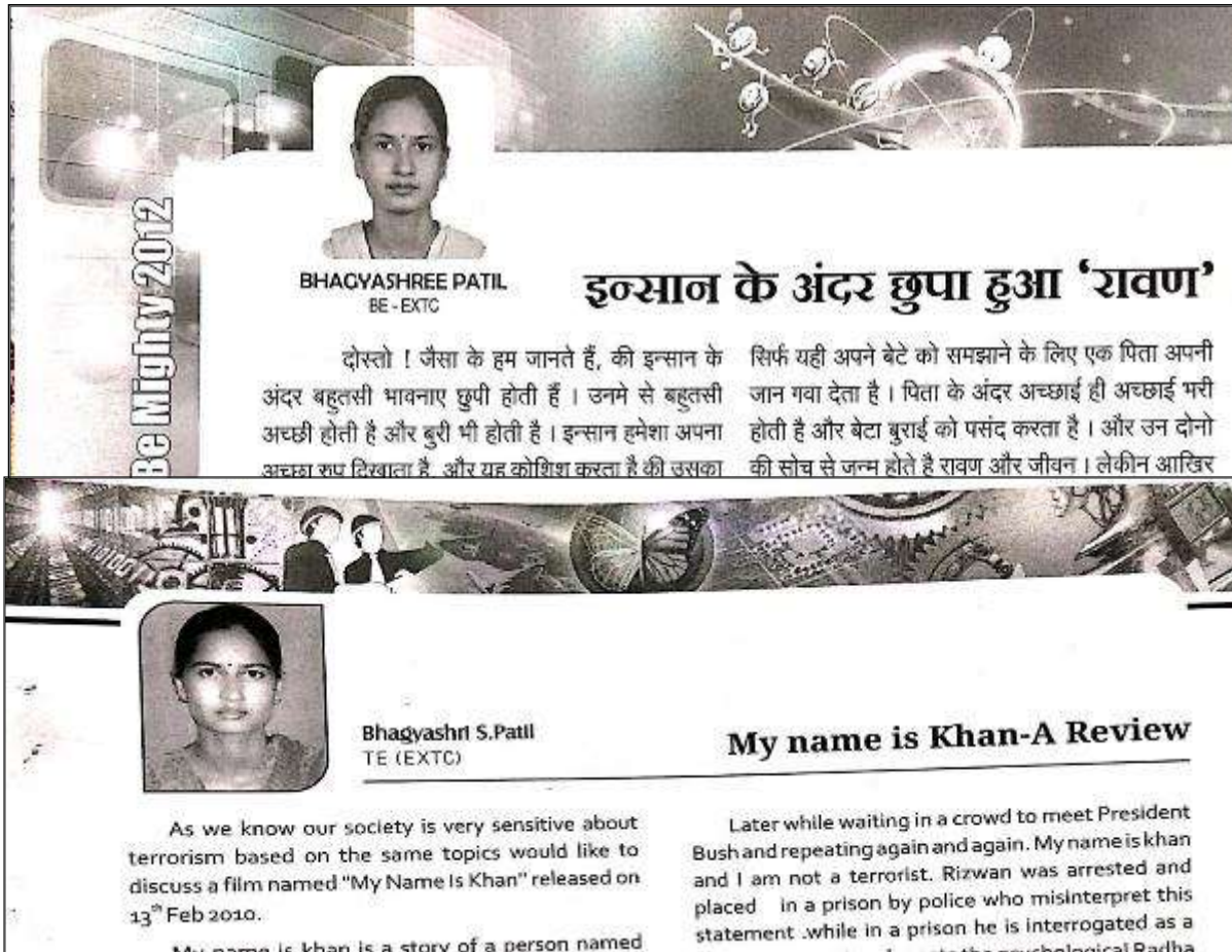
८.२ मॅगझीनमधले लेख