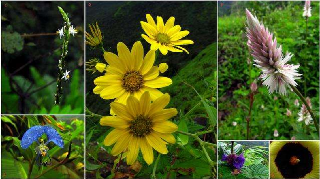
Flora seen during Trek to Vikatgad (Peb) near Matheran